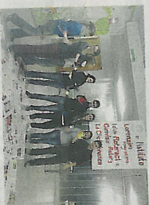
In azione i volontari all'Istituto Lorenzini

Sono i volontari di MilanoAltruista l'organizzazione che porta in Italia il volontariato