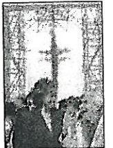
Il sindaco alla Barona

È STATA inaugurata ieri una parte del parco pubblico — 7,4 mila metri quadrati su un totale di quasi 22 mila — ed è stato aperto il cantiere del centro per anziani e del micro-nido per bambini. Il Villaggio Barona — che ospita servizi di assistenza, residenze e spazi tempo libero e cultura — cresce sempre più. Nato dalla collaborazione tra la fondazione Cassoni e la parrocchia di Santi Nazario e Celso, ha portato alla rinascita di un'area di oltre 45 mila metri quadrati. «Un esempio straordinario di riqualificazione urbana» lo ha definito il sindaco Letizia Moratti, mentre monsignor Erminio De Scalzi, vescovo ausiliare, parla di un «esempio di riqualificazione umana, prim'ancora che urbana».